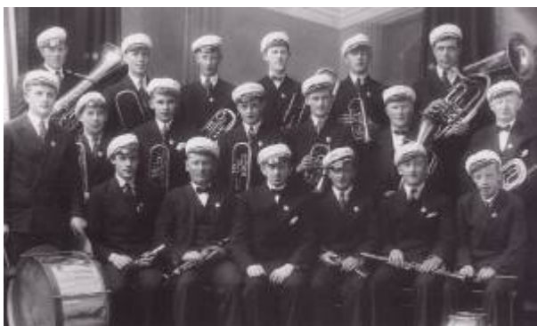
Arbeiderkorpset medio 1930.

Arbeiderkorpset ble stiftet i 1931 av ivrige medlemmer av Kommunistpartiet , etter at partiet gjennom en retts sak hadde fått eiendomsretten til musikkinstrumenter som hadde tilhørt det gamle Arbeiderpartiet . Hovedhensikten med korpset var å delta med musikk på partiets arrangementer, men etter hvert deltok korpset på mange ulike lokale arrangementer