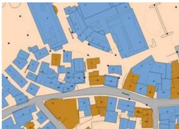
Kart: Eigersund kommunes kartløsning

Smuget mellom parkeringsplassen på Arenes og Nytorget , med arm til Storgaten . Den fikk sitt navn i 1998.