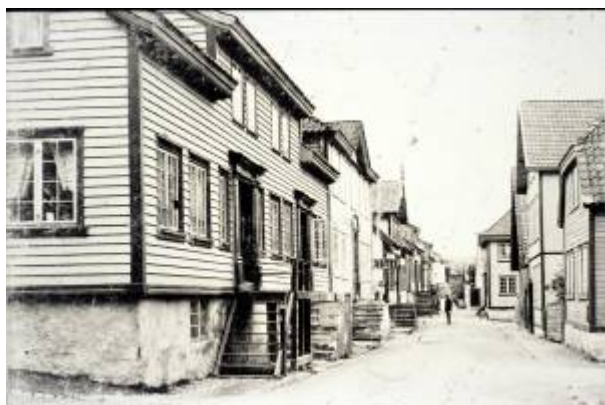
I Strandgaten er senempiren den dominerende stilarten.

Den bebyggelsen vi har innenfor de gamle bygrensene fra 1846 viser få spor etter bygninger fra den tidligste bydannelsen på 1700-tallet. Den tidligste bybebyggelsen var oppført i en lokal tradisjon basert på generasjoners kunnskap om bygningstyper og byggeteknikker, og folk bygde stort sett der hvor muligheten bød seg. Fortsatt kan bebyggelsen på Haugen gi en indikasjon på dette.