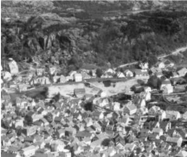
Aurgrua på Årstad.

Gammelt grustak som lå i forlengelsen av Aarstadgaten , helt ved bygrensa. Området ble utbygd med 15 bolighus på slutten av 1930-åra. Det var da det siste større tomtearealet som var tilgjengelig innenfor bygrensa. 1) 2)