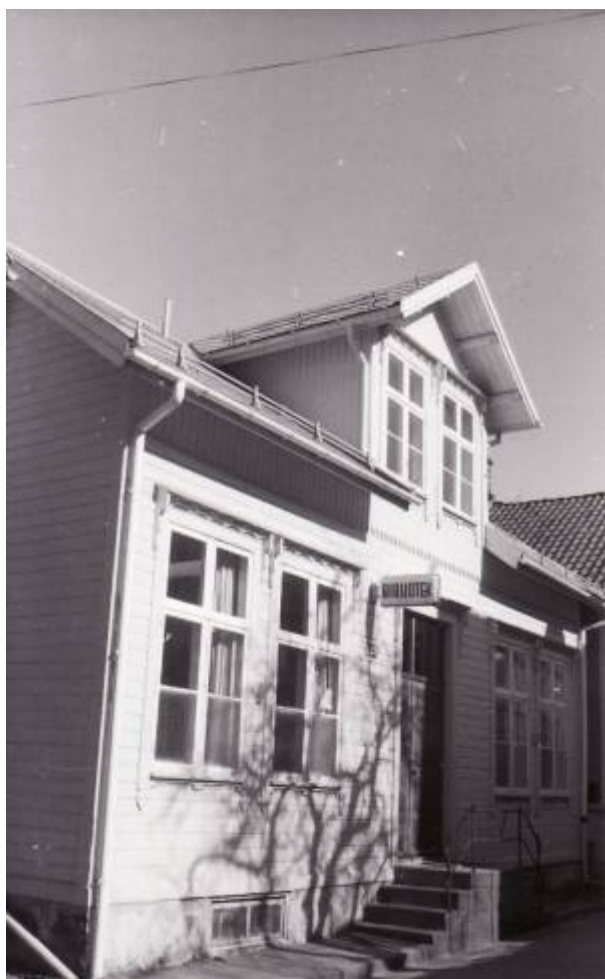
Biblioteket holdt til i Peder Clausens gate 28 fra 1959 til 1986.

I 1899 ble det igjen søkt om statstilskudd, denne gang på kr 200. Søknaden ble innvilget, og siden ble statens tilskudd årvisse.