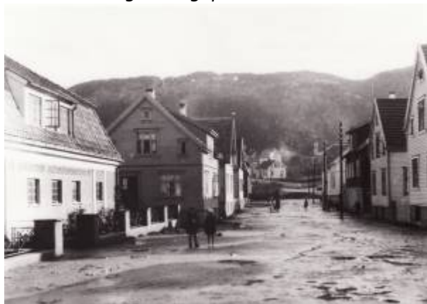
Bøckmans gate ca 1930.

Gate på Reinen og Gåsehølen , vist og omtalt som Langgaden i Reguleringsplan 1858 . Den var lagt parallelt med Abraham Sørensen Bøckman sitt våningshus, i krysset med gate nr. 11, nåværende Oluf Løwolds gate , og i sør-østlig retning mot ræget som førte fra Mosbekk plass til mølla ved Lundeåne . Over Reinen , mellom Oluf Løwolds gate og Lervika , var den ikke regulert som en del av Langgaden, men som en egen gate, Gade No.14. Begge gatene hadde en regulert bredde på 10 alen (ca. 6 meter). Strekningen mellom Lervika og Elvegaten ble opparbeidet etter denne planen.