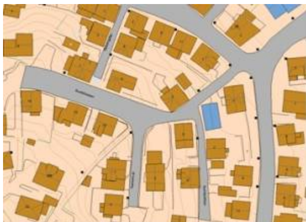
Kart: Eigersund kommunes kartløsning