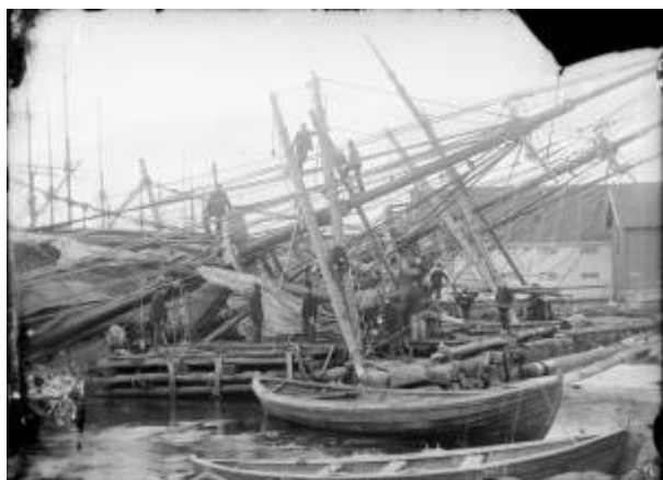
Kjølhaling på Bradbenken ca 1900.