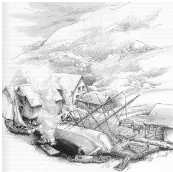
Livet på Bradbenken. Tegning: Reidun Lædre

En bradbenk er et sted hvor fartøyer ble kjølhalt og satt i stand. Det var her skutene ble tatt under behandling når de begynte å bli utette. Ordet "brad" betyr smelting, smøring og overstrykning med tjære eller smeltet bek. Selve betegnelsen bråbenk er i sjømannsspråket visstnok kommet fra middelnedertysk bråbank av brågen, kalfatre. «Kalfatre» betyr å tette fartøy med drev og bek. Vi har fått ordet gjennom nederlandsk fra arabisk qálfata, men det kommer kanskje opphavlig fra latin.