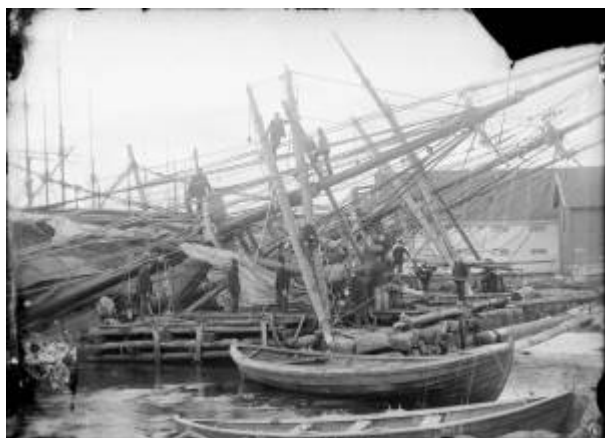
Kjølhaling på Bradbenken ca 1900.