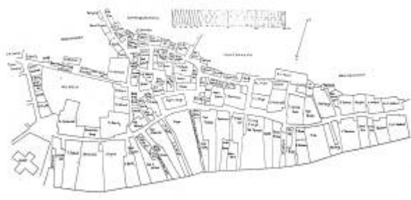
Tomte- og gatestruktur før brannen

Den startet den 14. september kl. 14:00 i huset til privatskolelærerinne og handlerske Anna Holbye . Huset hennes lå på en lang, smal eiendom som strakk seg fra Vågen til langt opp langs dagens Skriverallmenning . Da den hadde rast fra seg lå 2/3 av byen i aske og hundrevis av mennesker hadde blitt husløse. Mange hadde mistet nesten alt de eide.