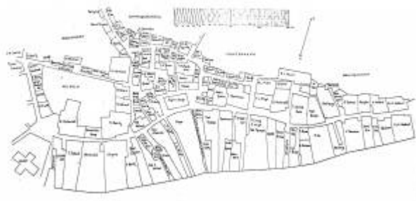
Tomte- og gatestruktur før brannen

Den startet den 14. september kl. 14:00 i huset til privatskolelærerinne og handlerske Anna Holbye . Huset hennes lå på en lang, smal eiendom som strakk seg fra Vågen til langt opp langs dagens Skriverallmenning . Da den hadde rast fra seg lå 2/3 av byen i aske og hundrevis av mennesker hadde blitt husløse. Mange hadde mistet nesten alt de eide.