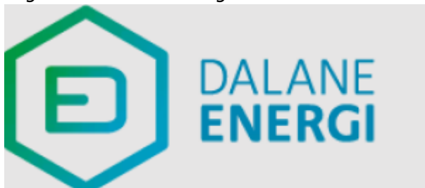
Logoen til Dalane Energi i 2025

Interkommunalt selskap som ble etablert som Dalane Elverk 01.01.1978 av kommunene Bjerkreim, Eigersund, Sokndal og Lund. Hver av kommunene gikk inn i selskapet med sine elektrisitetsverk. Selskapet skiftet navn til Dalane Energi 01.01.2000. Det eies av de nevnte kommuner med eierandeler i forhold til folketallet.