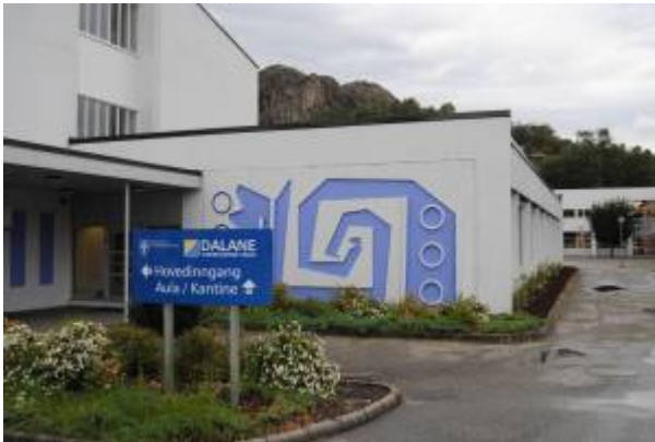
Dalane videregående skole, 2010.

Den 1. januar 1990 ble tre videregående skoler i Dalane, Eigersund videregående skole , Dalheim videregående skole og Dalane videregående skole, samlet til en skole under navnet Dalane videregående skole. Den nye skolen ble etablert på Lagård.