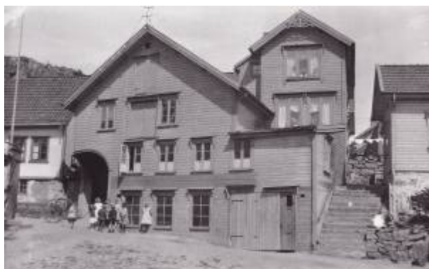
Bygningskomplekset til Damsgaard Potteri.