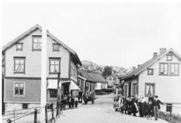
Damsgård bru, cirka 1895/96.

Bru over Lundeåne , mellom Elvegaten og Gamleveien .