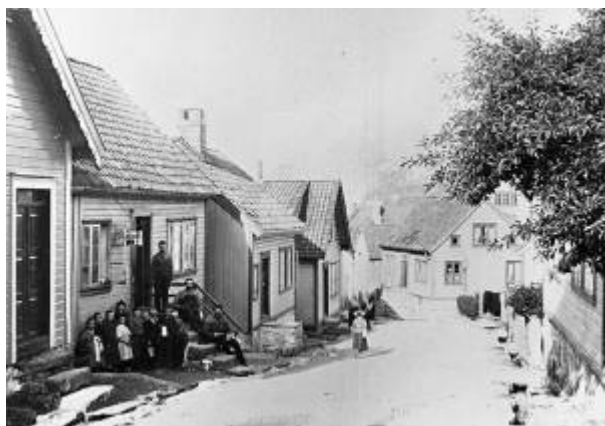
Fra Damsgård i 1890-åra. De fleste personene på bildet snakket nok damsgårdsdialekt.

Damsgårdsdialekten var en variant av Egersund bymål med uvanlig mange gamle språktrekk bevart. Den er blitt knyttet til bydelen Damsgård , et utpreget arbeiderstrøk der byens ledende bedrift, Egersunds Fayancefabrik , var dominerende gjennom generasjoner.