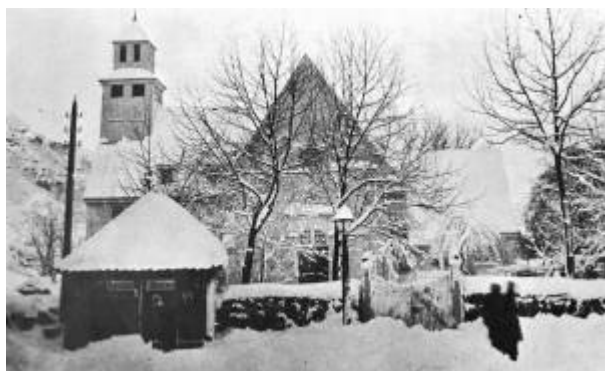
Egersund kirke ca 1890.

Av kirkeregnskapet for 1619 framgår det at kirken trengte reparasjon. Da var den så skral at tømmermennene fikk ekstra betaling for å utføre det farefulle arbeidet. I årene 1623 – 1634 ble det arbeidet med en ny kirke, og sistnevnte år fikk åtte mann lønn for «at neder Riffue det gamle støcke Kierche». Den kirken som ble bygget i disse årene er den eldste delen av dagens kirke, som opprinnelig var en liten langkirke.