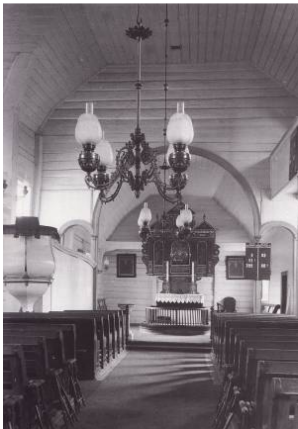
Interiør fra kirken før den siste innvendige restaurering.