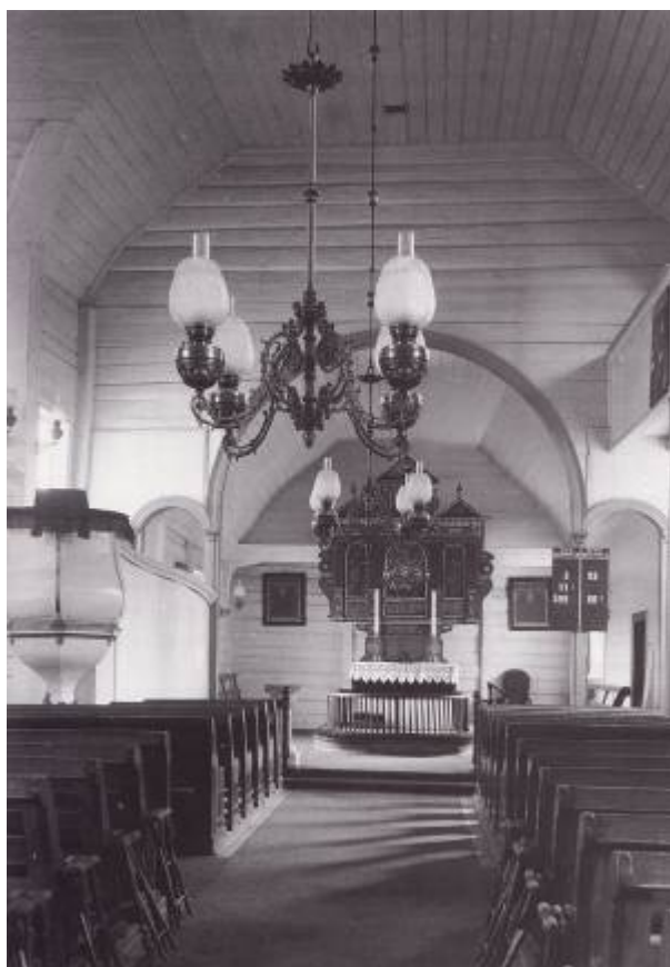
Interiør fra kirken før den siste innvendige restaurering.