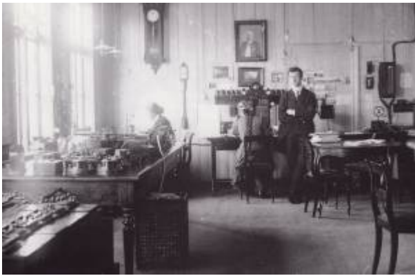
Egersund Telegrafstasjon ca 1900.

tjeneste som formelt ble etablert i september 1893 og som nådde Egersund i 1898. Telefonanlegg innenfor den enkelte kommune var imidlertid fritatt for konsesjon, og i Egersund ble Egersunds Telefonselskab stiftet i 1895.