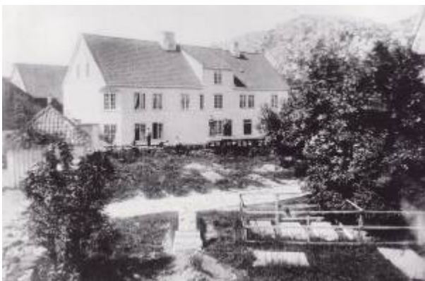
Fra 1873 til 1935 holdt Egersund Telegrafstasjon til i Torget 1B.