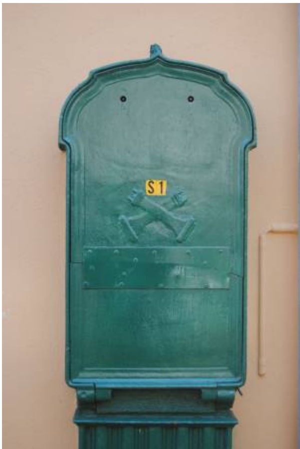
Koblingssskap for Egersunds Telefonselskab.

Byens første telefonlinje ble satt opp mellom jernbanestasjonen og Dampskipskaien i slutten av mai 1887 av tre unge teknologiforkjempere. De to viktigste kommunikasjonspunkter i byen hadde dermed fått et godt hjelpemiddel for å samordne korrespondansen mellom båt og tog.