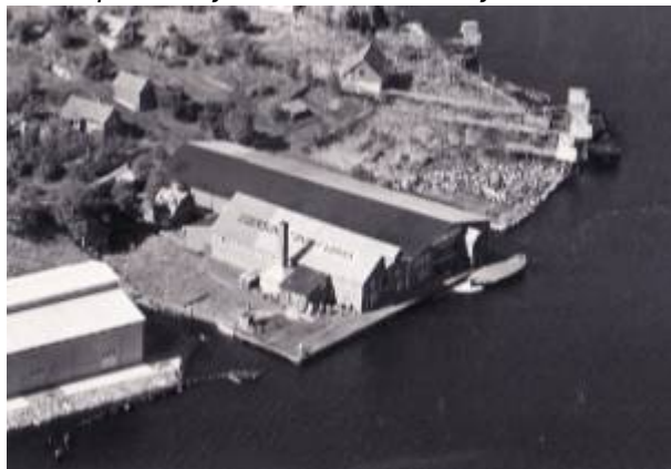
Tønnefabrikken på Grønehaugen 1953.

Sildefiskeriene gjorde at behovet for tønner var stort. Mye måtte kjøpes utenbys, men utover på 1900-tallet var det flere mindre bøkkerverksteder i drift i byen – i den mest hektiske jobbetiden ca 20.