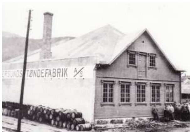
Tønnefabrikken i Møllegaten 9, 1917.