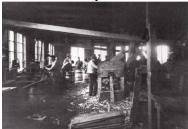
Tønneproduksjon 1917.