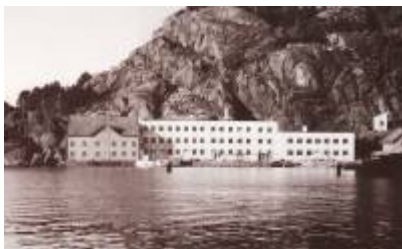
Den gjenoppbygde Eie Stentøifabrikk etter brannen i 1938.

Deretter var det stabil drift fram til 1938, da bedriften igjen ble rammet av brann. Etter denne brannen ble fabrikkens gjenreist i helt ny skikkelse og kunne i 1939 starte produksjon i en helt ny og moderne, funksjonalistisk fabrikkbygning. Nytt, moderne maskineri var også anskaffet, slik at bedriften sto godt rustet til den nye hverdagen etter andre verdenskrigs slutt.