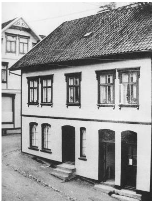
Meieriet i Johan Feyers gate 9.