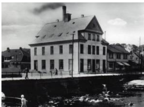
Eigersund Meieri i Elvegaten. 1932.

Først på årsmøtet i 1927 ble det fart i planene om å bygge et nytt meieri. En tomtekomite på tre personer ble valgt, og denne anbefalte allerede tre måneder senere at eiendommen Elvegaten 19 ble kjøpt inn til formålet. Generalforsamlingen godkjente forslaget, og på årsmøtet i 1928 ble det besluttet å bygge nytt meieri og ysteri på tomta.