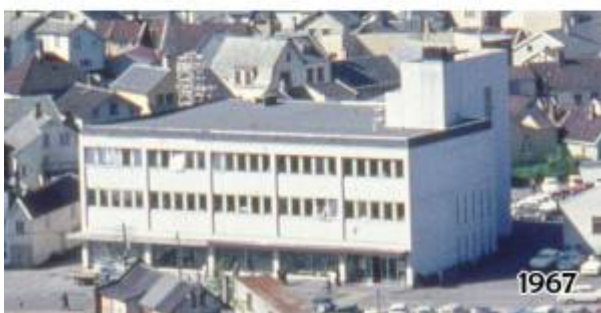
Bygging av Sentrumsgården trinn for trinn.

Etter krigen ble det i flere år arbeidet med planer for et nybygg, men først i 1965 kunne forretningen flyttes over i et første byggetrinn av et nytt varehus som hadde blitt reist på Nytorget , ved siden av bygningen i Jernbanegaten 8. Høsten 1966 ble den gamle bygningen revet og andre byggetrinn av varehuset påbegynt. 28. oktober 1968 kunne så endelig Eikunda åpne et topp moderne varehus sentralt i byen. Bygningen er i dag kjent som Sentrumsgården.