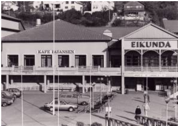
Eikunda 1986.

Eigerøy ble avviklet i 1983 mens filialen på Eie var i drift ut januar 1985.