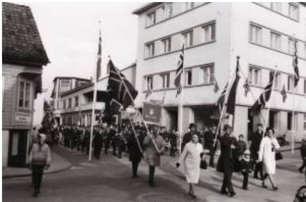
1. mai 1971. Demonstrasjonstoget i krysset Storgaten - Johan Feyers gate.

Storpolitikken og konfrontasjoner mellom øst og vest i etterkrigstiden førte igjen til splittelse i arbeiderbevegelsen, og i 1948 var det slutt på felles 1. mai-feiring i byen. Det ble Egersund Faglige Utvalg sammen med Arbeiderpartiet som kom til å dominere feiringen, mens kommunistene hadde sitt eget arrangement. Deretter kom flere år med to parallelle arrangementer det Arbeiderpartiet sto for det tradisjonelle mens kommunistene hadde en enklere markering. I 1954 sluttet kommunistene å offentliggjøre sitt program, men de fortsatte en tid med sin "private" feiring av dagen.