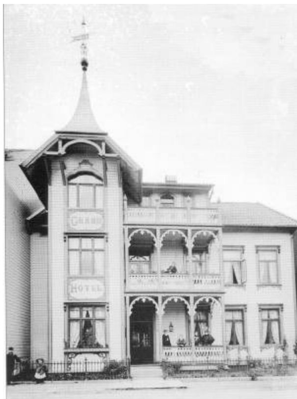
Grand Hotels første bygg, bygget på branntomta til Hotel Jæderen. Cirka 1897.