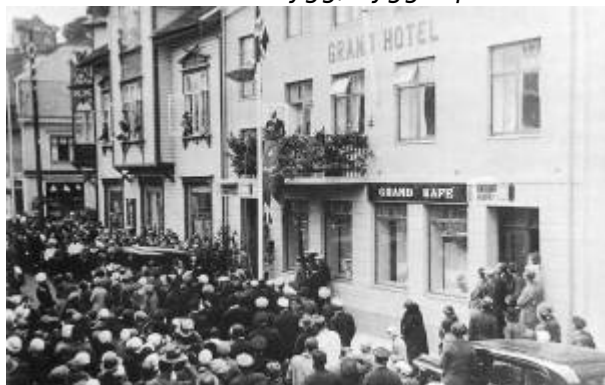
Kong Haakon på balkongen på Grand Hotel under kongebesøket 3. juli 1934.