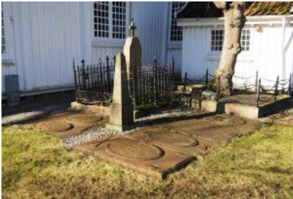
Fra gravplassen ved Egersund kirke.

Fram til 1804 ble kirken og området rundt brukt som gravplass både for byens og distriktets befolkning. Noen lik ble gravd ned under kirkegulvet, andre i jorda rundt kirken. Rundt 1800 kom det forbud mot å gravlegge folk under kirkegulvet, og alle lik ble siden gravlagt utenfor kirken.