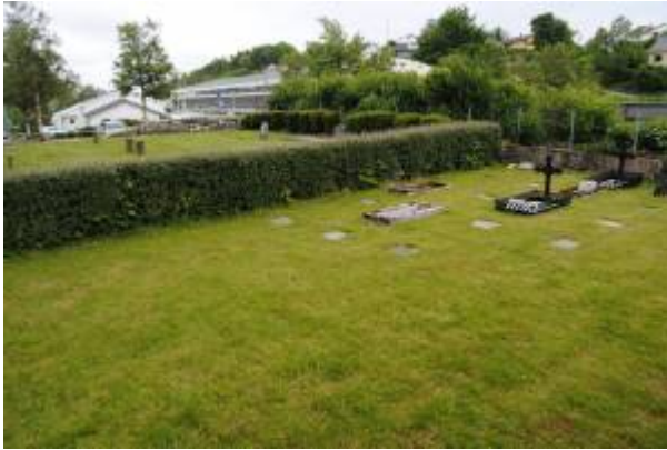
Gravplassen ved Husabøveien. Det almindelige Samfunds del nærmest.

Ved Husabøveien, i krysset med gangvegen som fører til Fjellstedveien, er det en mindre gravplass. Denne tilhører menighetene Samfundet (den søndre delen) og Det Almindelige Samfund (den nordre delen). Samfundets gravplass ble tatt i bruk i 1897, mens Det Almindelige Samfund etablerte sin plass etter splittelsen i 1901. Samfundets del ble benyttet fram til 1924, da menighetens kirkegård på Årstad ble tatt i bruk. På Det Almindelige Samfunds del var den siste begravelsen i 1932.