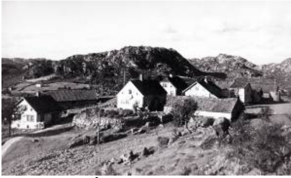
Klyngetunet på Hafsøy.

Den opprinnelige gården på Hafsøya . I gammel tid var det vanlig at når en gård ble delt, bygde eieren av det fradelte bruket seg hus tett opp til det gamle gårdstunet. Slik oppsto det etter hvert et klyngetun.