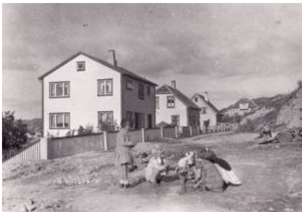
Hammers gate rundt 1938.

Gate på Strandabakken som går fra krysset Johan Feyers gate/Årstadgaten og vestover.