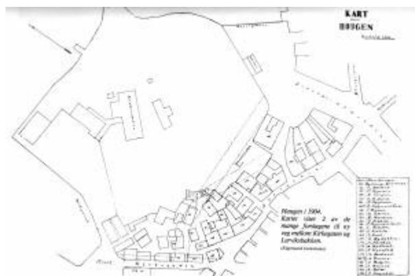
Kart over Haugen 1904 med ulike forslag til Jernbanegaten.

Fastsatt som gateadresse i 1969. Egentlig et område- og ikke et gatenavn. I fig. vedtaket skulle gatenavnet Jernbanegaten utgå og erstattes med Haugen. Fortsatt (2011) er det imidlertid eiendommer som har adresse til Jernbanegaten. 1)