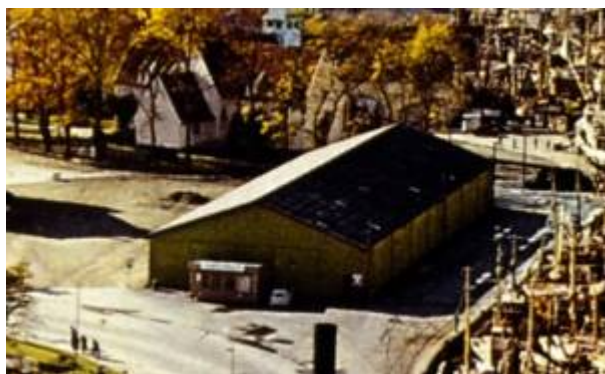
Havnelageret i 1960-åra. Foto: Fotohuset/DF (Utsnitt)

Havnelageret var et lagerbygg som ble oppført på Jernbanekaien i 1959. Byens myndigheter tilla bygget en sentral rolle for den videre økonomiske utvikling og en forutsetning for å kunne oppnå ønsket vekst. Da bygget ble revet våren 1989 hadde det neppe svart til forventningene, og få beklaget at det ble fjernet. 1)