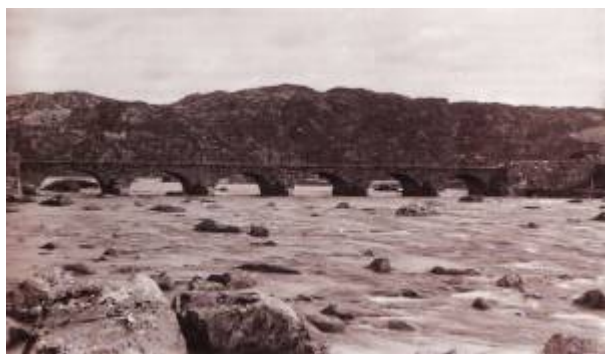
Hestvad bru.

Bru over Eieåne der denne springer ut fra Slettebøvannet.