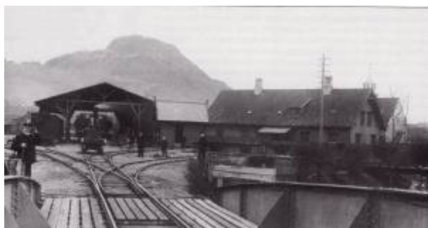
Egersund jernbanestasjon.

Jærbanen er navnet på jernbanestrekningen mellom Egersund og Stavanger.