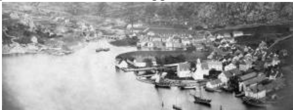
Egersund cirka 1870