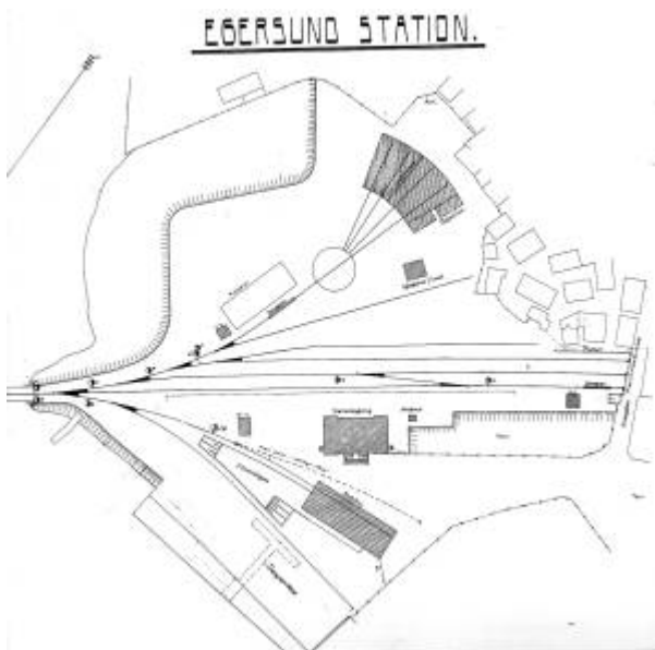
Plan over det nye stasjonsområdet i sentrum.

Hovedbygningen på gården, Nesgård , ble tatt i bruk som stasjonsbygning. Ikke fordi det var spesielt hensiktsmessig, men fordi det sparte statsbanene for å bygge en ny stasjonsbygning. Ellers ble stasjonen opparbeidet med pakk- og godshus, et pakkehus med plattform, svingskive, lokomotivstall med smie og vanntårn som fikk sin forsyning fra Egersund vannverk . På kaien ble det reist en svingkran.