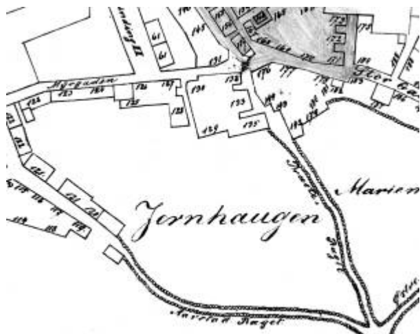
Utsnitt av Bykart 1868