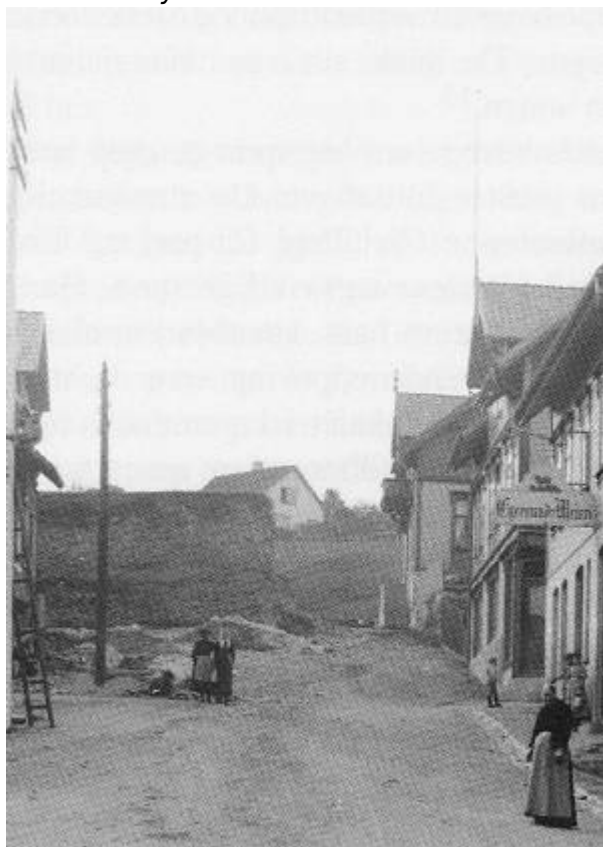
Jernhaugen under utgraving til venstre i bildet.

Området var opprinnelig en løkke med utstrekning omtrent mellom Kirkegaten - Aarstadgaten - Storgaten .