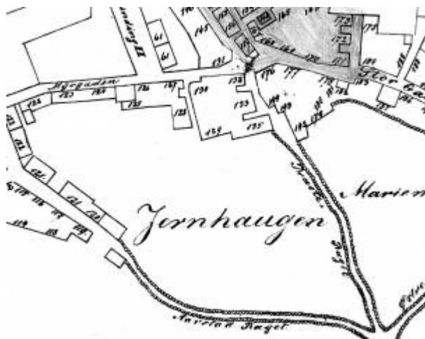
Utsnitt av Bykart 1868