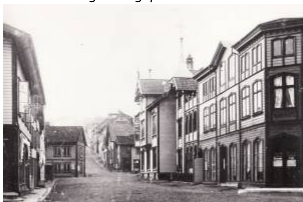
Johan Feyers gate, 1897.

Gata ble regulert som Branngate i Reguleringsplan 1858 , og gikk da helt til bygrensa. På plankartet er den benevnt Alminding II . På bildet fra 1890-åra er den fortsatt ikke helt gjennomført som branngate, men i 1905 var den opparbeidet etter reguleringsplanen og hadde bebyggelse på begge sider på strekningen mellom Torget og Årstadgaten. I Reguleringsplan 1905 ble den regulert fram til Gamle Prestegårdsvei .