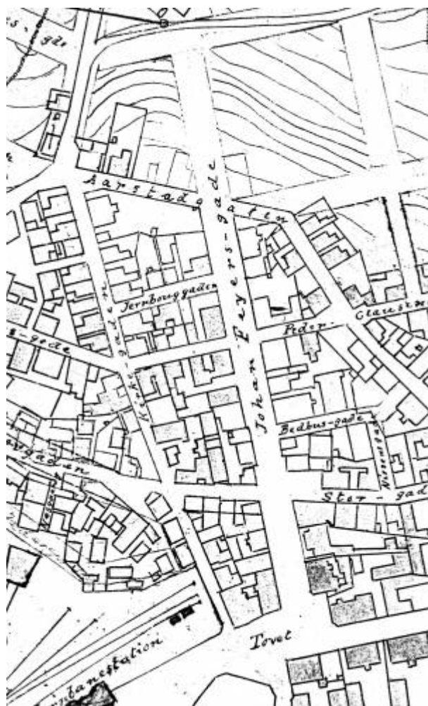
Utsnitt av Reguleringsplan 1905