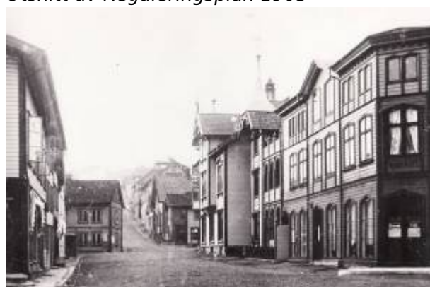
Johan Feyers gate, 1897.

Gata ble regulert som Branngate i Reguleringsplan 1858 , og gikk da helt til bygrensa. På plankartet er den benevnt Almindig II . På bildet fra 1890-åra er den fortsatt ikke helt gjennomført som branngate, men i 1905 var den opparbeidet etter reguleringsplanen og hadde bebyggelse på begge sider på strekningen mellom Torget og Årstadgaten. I Reguleringsplan 1905 ble den regulert fram til Gamle Prestegårdsvei .