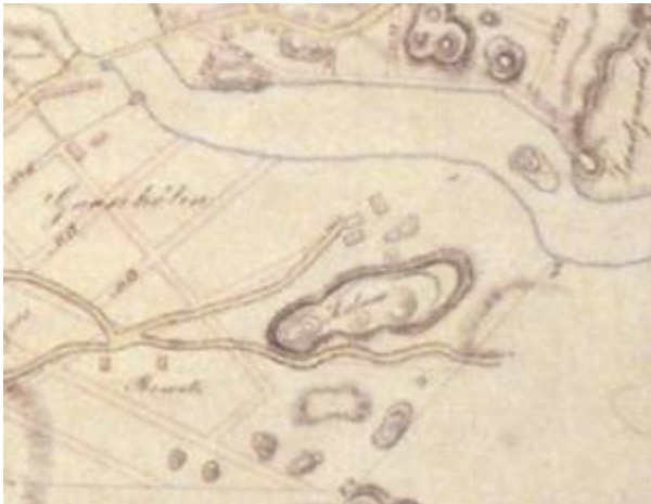
Utsnitt av Reguleringsplan 1858