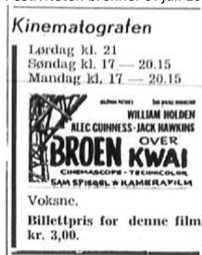
Annonse i Dalane Tidende 20.02.1959