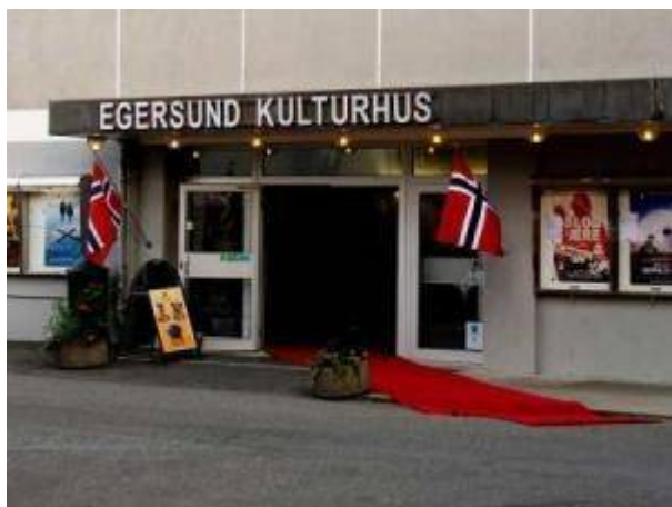
Egersund kulturhus.

Byen hadde med dette fått en ny storstue med sitteplass til 380 personer i myke stoler på skrånende golv. Bygget hadde dessuten klimaanlegg. Det tekniske utstyret var av det beste som kunne skaffes, og kinolerretet var hele 9 meter bredt slik at filmer i det nye formatet «Cinemascope» kunne vises. Det var mange som mente at byen hadde fått landets vakreste kino!