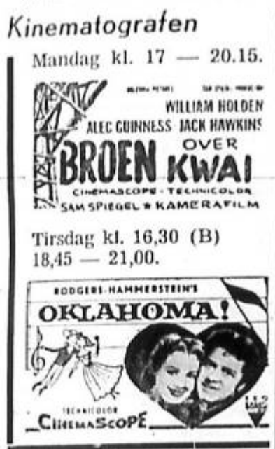
Annonsen i Dalane Tidende 23.02.1959

Men folk ønsket kino. I 1921 var det slutt på Arbeiderpartiets tålmodighet, og partiet lot prinsippene falle. På slutten av året stiftet flere partimedlemmer Egersunds Selskabelige Forening, hvis formål var å vise film i Folkets hus - Festiviteten i Sandakergaten 6. Offentlige konsesjonsvilkår ble unngått ved at man måtte være betalende medlem i foreningen for å kunne delta på «møtene», dvs. filmframvisningene. Det første «møte» ble holdt 17. februar 1922, og den svenske filmen «Körkarlen» sto på programmet. Den lukkede foreningen ble en stor suksess fra første dag, og allerede etter få dager hadde den fått over 500 medlemmer. Men medlemskapet var ikke mer eksklusivt enn at det kunne tegnes av hvem som helst sammen med kjøp av billetten.