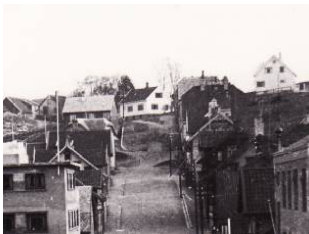
Kjeldebakken, 1937. Foto: Nic. Torgersen/DF (Utsnitt)

Bakken mellom Aarstadgaten og Kjeld Bugges gate , i forlengelsen av Johan Feyers gate , navnsatt i 1969.