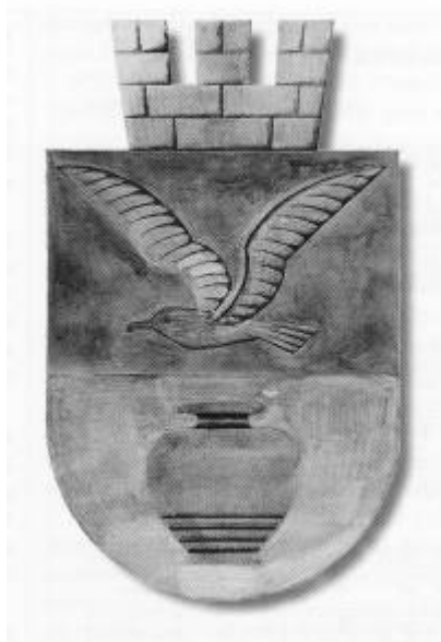
Utkast til byvåpen 1939

I januar 1937 ble det bevilget 50 kr til arbeidet med å få laget et byvåpen for ladestedet. Av 11 innkomne forslag samlet bedømmelseskomiteen seg om et utkast fra Alf Feyling Larsen, der motivet var todelt: en flygende måke og en fayansevase. Utkastet ble bearbeidet etter de heraldiske kravene til et byvåpen, men da det kan være vanskelig å kombinere disse kravene med ekte bypatriotisme fortok entusiasmen seg. Av flere grunner ble saken i realiteten lagt på is og deretter innhentet av begivenhetene i 1940. 1)