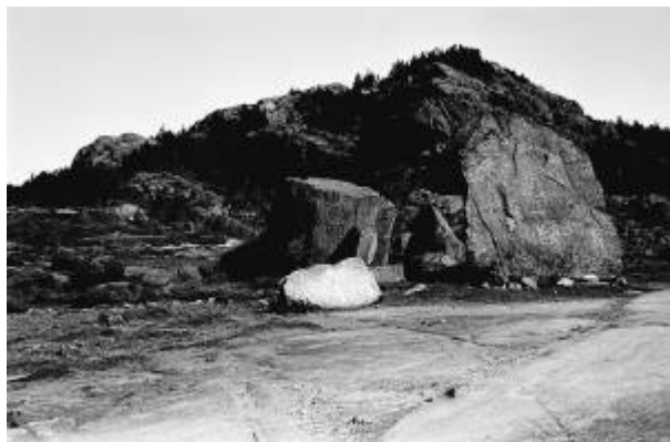
Låvaberget, 1943.

I Vannbassengan går den gamle vegen mellom byen og gårdene i heia innenfor, nå en del av Lysløyva , over et flatt berg som kalles Låvaberget og som ligger like ved Nordsjøen . Helt opp mot 1950-åra ble plassen brukt som danseplass for folk fra byen og gårdene omkring, men både navnet og plassen tyder på at det flate berget fra gammelt av ble brukt som treskeplass. 1)