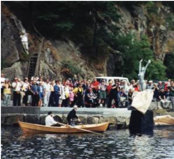
Linda avdukes under stor festivitas.

Skulptur i aluminium som står i Lindøygapet . Den ble finansiert av SR-Bank og Simrad, og er utført av Hannu T. Konttinen. Skulpturen ble avduket av Mikal Hovland og Thor M. Thorsen 29. juli 2000, under Kyststevnet 2000. 1)