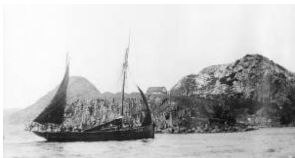
En kutter passerer Lindøya.

Lindøya ligger på gården Eies grunn, ved innløpet til Vågen , og har sitt navn etter treslaget lind. Nå for tiden vokser det lite lind vilt i Dalane, så navnet minner oss om andre naturgitte forhold enn dagens. Øya har forlenget blitt landfast gjennom utfylling. Forbindelsen mellom Lindøya og fastlandet kalles Lindøyhalsen.