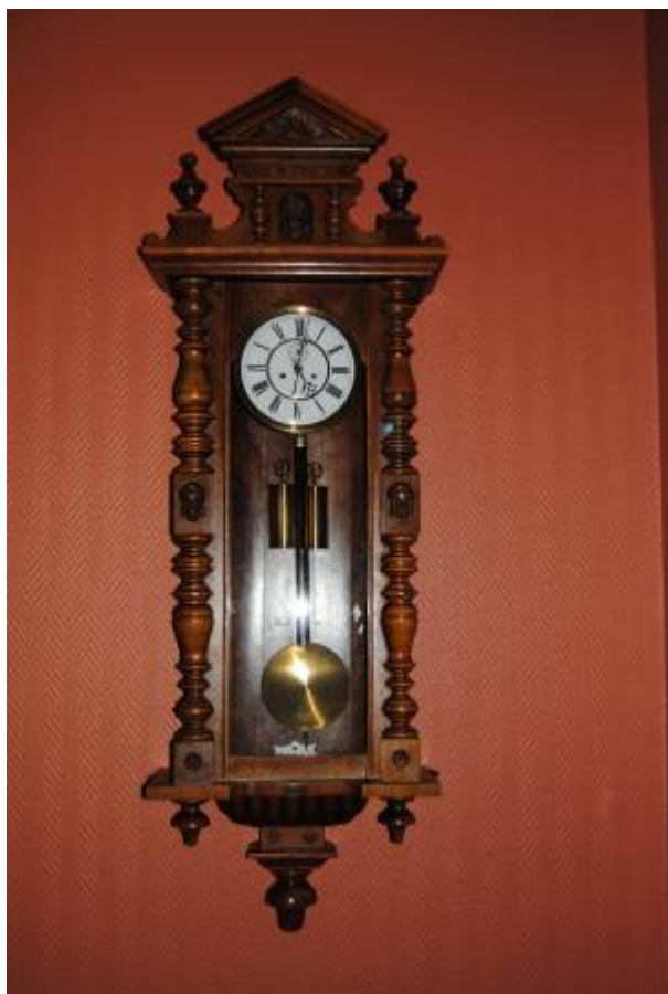
1. januar 1895 måtte egersunderne stille klokka fram 40 minutter.

Lokaltid, eller rettere lokal middelsoltid , kom i alminnelig bruk først på 1800-tallet. Den ble som hovedregel satt slik at klokka var tolv når solen sto høyest på himmelen. Slik også i Egersund. Konsekvensen av dette var at tidsangivelsen var ulik for steder som lå på ulike lengdegrader. For eksempel står sola i sør over Egersund 20 tidsminutter etter at den står i sør over Oslo 1) . Fram mot 1850 var dette ikke noe problem, men etter hvert som kommunikasjonene bedret seg økte behovet for et felles tidssystem for hele verden.