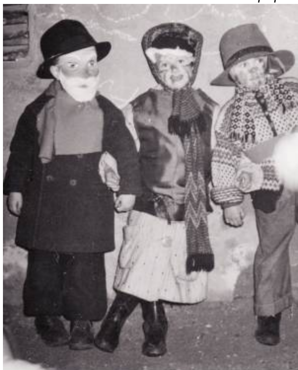
Lossi, ca. 1970.

Å gå lossi vil i dag si å kle seg ut og dra fra dør til dør, syngje julesanger og få godteri som belønning.