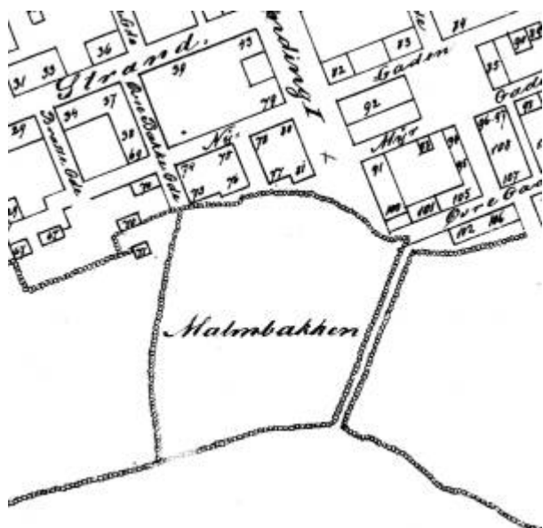
Utsnitt av Bykart 1868

Malmbakken var et jordstykke under Årstad som lå omtrent der Malmgaten nå ligger - beliggenheten er bl.a. vist på Reguleringsplan 1858 . Betegnelsen kommer muligens av at en familie som het Malmø eide stykket, men det kan også bety at det var en sandbakke her (malm kan bl.a. bety sand). 1)