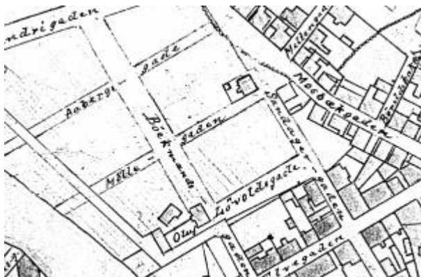
Utsnitt av Reguleringsplan 1905