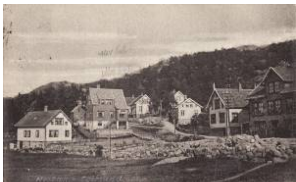
Mosbekk, ca. 1916.

Bydel rundt Mosbekk plass . Mose er et eldre ord for myr, og bunnen av Årstaddalen var tidligere et myrhull. Navnet Mosbekk betyr mest sannsynlig bekken som renner gjennom myra. 1)