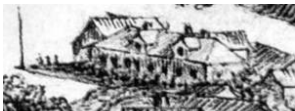
Nesgård sett fra Varberg, skisse av Jonas Nicolai Prahm i 1853, året før ombyggingen i 1854.