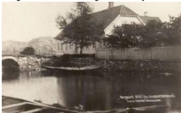
Nesgård mellom 1854 og 1878. Kirkeviken i forgrunnen. I fotoet står teksten «Nesgaard 1850», men dette må være tatt etter 1854 da det er den ombyggede Nesgård vi ser i fotoet.