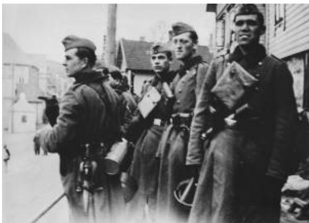
Tyske soldater ved Brådbenken.