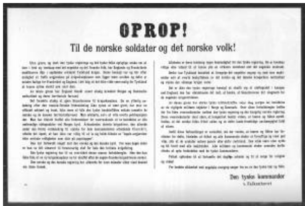
Oprop! Til de norske soldater og det norske folk! ble slått opp over hele landet.

Etter at Eickhorn sammen med sine offiserer omsider hadde inntatt sitt første måltid på norsk jord: lunsj på Grand Hotel , dro han sammen med telegrafspesialisten til Hestnes for å ta kabelen i nærmere øyesyn. Der sjaltet spesialisten ut kabelen slik at det nå var brudd på to steder 3) .