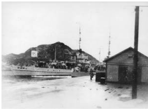
M2 og M13 legger fra kai.

Snaut 10 minutter etter at M1 hadde lagt til kai var Eickhorn på vei inn Strandgaten sammen med Oberleutenant Hopp og ca. 20 mann 1) . Resten sto igjen på kaien for å passe på krigsfangene fra «Skarv» og alt utstyret som hadde blitt losset. Lossingen var gjort på mindre enn 15 minutter, og M1 la deretter fra kai. Kort tid etter la M9 til kai. Den brakte med seg 40 nye soldater, flere sykler samt motorsykler. Så snart lossingen var unnagjort ble en sykkelpatrulje sendt ut Varbergveien for å opprette en mitraljøsepost på kaien til Ryttervik Fabrikker . Ca. kl. 05:30 ankom de forsinkede M2 og M13 byen og fikk losset soldater og utstyr. Klokket 05:57 forlot de tyske minesveiperne Egersund med kurs hjem mot Tyskland.