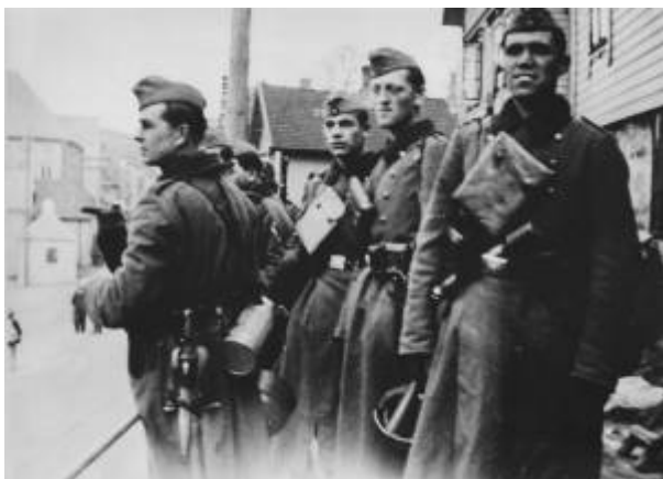
Tyske soldater ved Bradbenken.