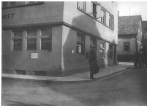
Tysk vakt utenfor Telegrafstasjonen.