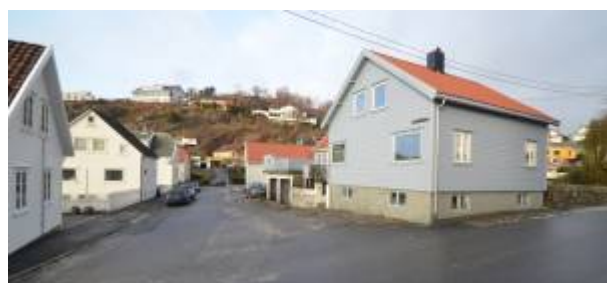
Kirkegårdsmuren sees t.h..

Kirkegård henspeler på den gamle Gravplassen ved Gamleveien som ligger like nord for gata. At den kalles Øvre henger sammen med at det på Reguleringsplan 1905 var regulert ei gate mellom Gamleveien og Langaards gate (omtrent i forlengelsen av Øvre Kirkegårdsgate) som ble gitt navnet Nedre Kirkegaardsgaden. Denne ble aldri bygd, og falt ved en senere regulering bort. 1)